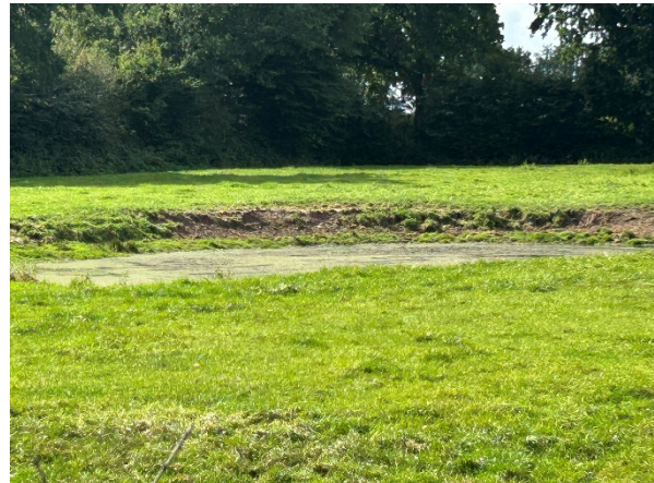
Stillgewässer (Sept. 2025)

Außerhalb grenzen nordwestlich wohnbaulich genutzte Grundstücke an. Im Osten, Süden und Westen befinden sich weitere landwirtschaftliche Nutzflächen.