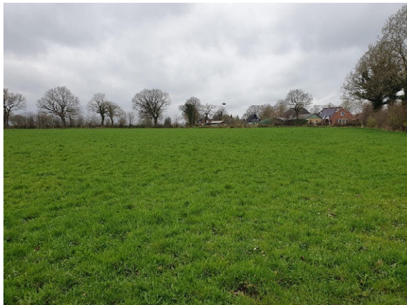
Grünland (April 2024)

Westlich des Plangebietes verläuft ein asphaltierter Fußweg (SVs) und nordöstlich die Straße Hancobsloh (SVs).